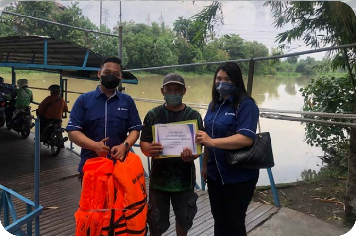
Pelampung - Ferry Tradisional (Getek) di Sungai Sidoarjo