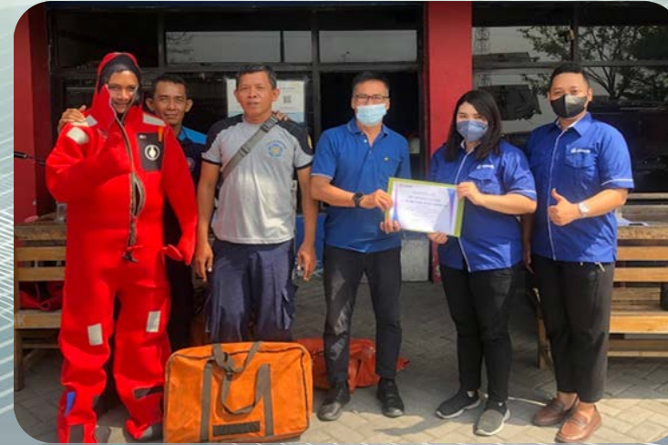
Baju Tahan Api - Kantor Pemadam Kebakaran Surabaya