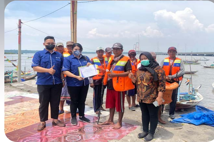
Pelampung - Nelayan di Pesisir Pantai Kenjeran Surabaya

Total Biaya CSR Tahun 2021 sebesar Rp. 152.760.000,-