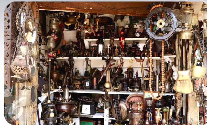
Kolektor Benda Antik