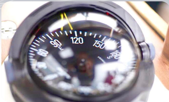
Retailer - UMKM