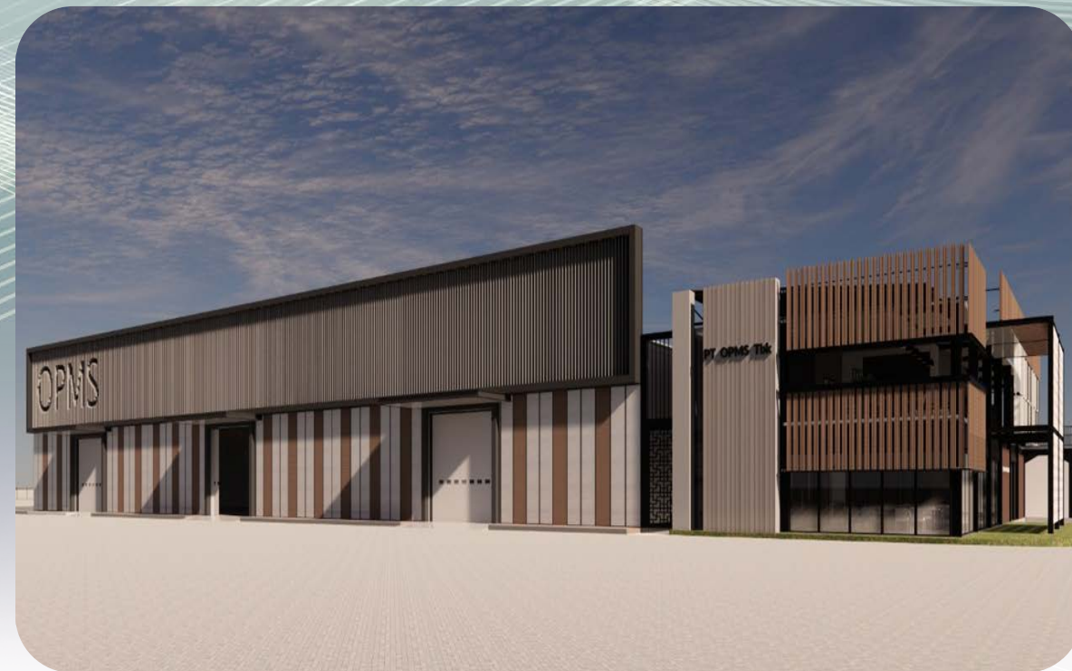
FOTO MAKET GEDUNG PT OPMS Tbk DI MADURA