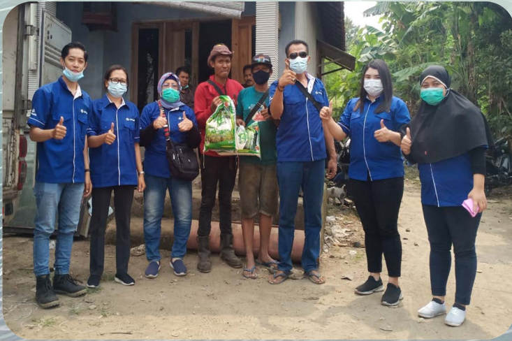
Pembagian Sembako - Desa Tanjung Jati , Kamal